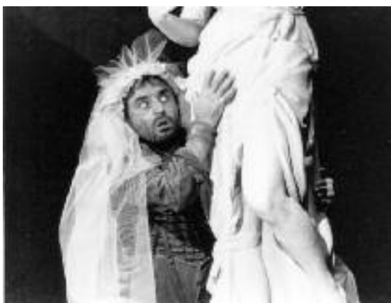
Due immagini dello spettacolo "La statua"

l'omonimo e "Una faccenda privata", siamo nella brutalità domestica, nella quotidianità di due coppie, in cui vige il predominio e la prepotenza del maschio sulla femmina. Vico Sirene "apparentemente" il più napole-